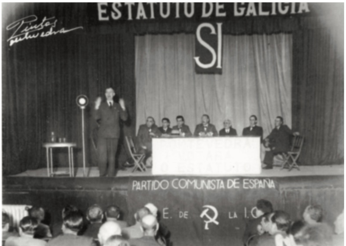
Mitin da campaña do Estatuto en Pontevedra.

Alén dos exemplos concretos de Rosalía de Castro ou Manuel Antonio, os autores de ‘Nacionalismo e anarquismo na Galiza’ realizan un percorrido por un século de Historia no que detectan relacións “moi febles” entre ambos movementos sociais. “O carácter maioritariamente refractario do anarquismo galego diante do feito diferencial e a práctica ausencia dun pensamento propio que asumise o legado dos hábitos comunitarios e de contrapoder estendidos historicamente ao longo da xeografía galega, poderían explicar a mínima relevancia das tentativas teóricas propias para adaptar o esquema libertario á cultura e á idiosincrasia galega; malia a persistencia da parroquia e das xuntas veciñais, o amplo rexeite do municipio estatal e a proliferación dos valores comunitarios e os bens en man común, este caldo de cultivo non foi aproveitado”, explican xa na introdución deste libro. “A identificación nos medios libertarios da fala e cultura populares cunha Galiza conformista e atrasada, cunha terra de “miserables y esclavos”, axudou ao desinterese”, engaden despois.